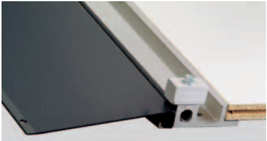
Skinne, stopper, gulv og skråplan.

Alle anlæg leveres – medmindre andet er aftalt – med gulv ilagt mellem skinner samt skrå forkant, der gør det lettere at arbejde mellem reoler og køre lagervogne ind.